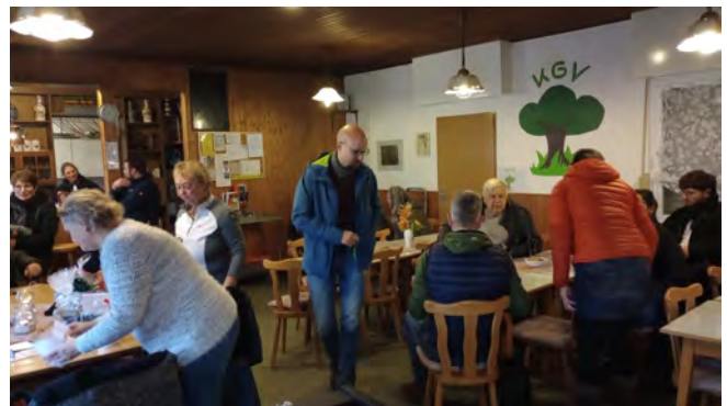
Aufwärmen bei Glühwein und Bockwurst

Nach über zweieinhalb Jahren Corona-Zwangspause war es endlich soweit: Es konnte wieder im Vereinsheim gefeiert werden. Dementsprechend groß war die Freude bei den Gästen. Bei Spießbraten und bayerischem Festbier wurde gemeinsam gefeiert, geklönt und gelacht, wenn auch etwas vorsichtiger und ruhiger als sonst. Man merkte deutlich, dass das Feiern nach so langer Zeit erst wieder „gelernt“ werden muss. Trotzdem war die Stimmung sehr herzlich und angenehm. Wir freuen uns auf ausgelassene Feste mit vielen Besuchern und ohne Einschränkungen.