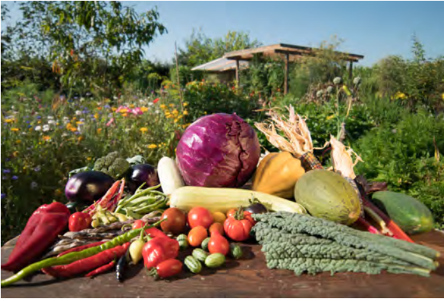
Sortenfeste Gemüsearten. Auch gut für Landwirte und die Welternährung!