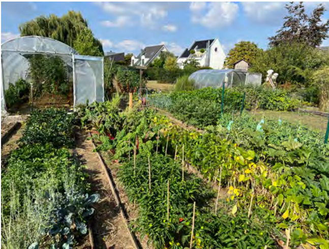
Auf 1.500qm baut Giovanni eigenes Gemüse an. Viel Arbeit, aber auch viel Ertrag!

Nein, ich nutze keine digitalen Tools zur Planung. Ich führe jedes Jahr ein Gartenbuch, in dem viel notiert wird. Und habe einige Tabellen entworfen, mit denen ich mich organisiere und den Überblick behalten kann bei den vielen Sorten, die ich anbaue und erhalte.