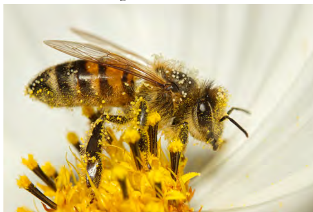
In einer Kleingartenanlage unverzichtbar: Bienen.

Es war gar nicht so einfach, einen passenden Namen zu finden. Denn alle eingereichten Namen waren toll. Aber letztendlich musste eine Entscheidung gefällt werden. Und die Entscheidung ist gefallen: Heckengeflüster . Die Hecke ist eines der Herzstücke einer Kleingartenanlage: Sie ist Streitthema und Kommunikationszentrum zugleich. An ihr trifft man sich und unterhält sich. Und ja: Manchmal schreit man sich auch über sie hinweg an. Aber wir bevorzugen die leiseren Töne. Und deshalb auch diese Entscheidung.