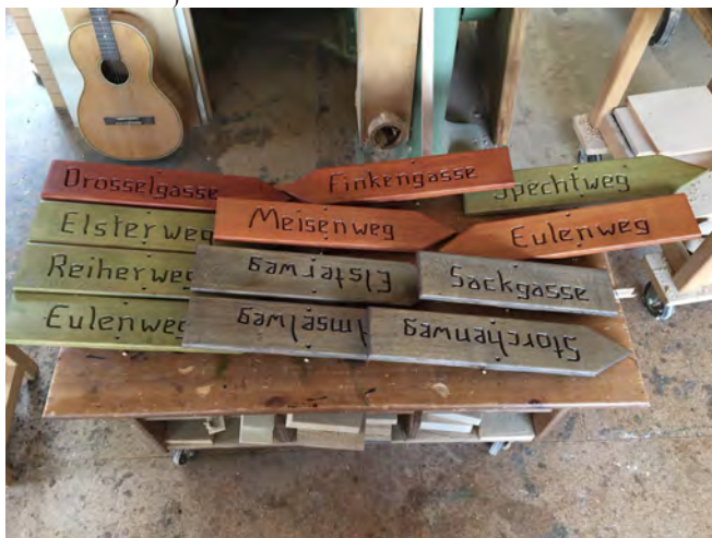
Die handgefertigten Wegweiser in der Werkstatt der Massivholz Tischlerei Udo Bode

Fast jeder kennt es: Man lädt Freunde zum Grillen ein und beginnt umständlich den Weg zu erklären: „Vom Parkplatz runter, dann den ersten Weg rechts rein bis zum Apfelbaum“. Plötzlich stehen die Gäste in einer Sackgasse, weil sie einen Weg gesehen haben, den man selbst nicht auf dem Schirm hatte. Damit ist jetzt Schluss.