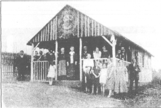
Unser erstes Vereinsheim um 1930.

Durch den Zusammenschluss der Städte war auch eine Zusammenlegung der Gartenbauvereine akut geworden. Eine Abstimmung der einzelnen Vertreter am 05.01.1931 ergab ein negatives Ergebnis. Von insgesamt 71 Stimmberechtigten stimmten nur 14 für einen Zusammenschluss.