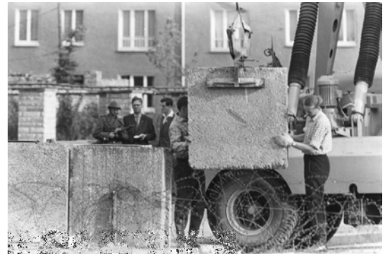
Aufstellen von Betonblöcken in Berlin.

Mit dem Bau der Berliner Mauer am 13. August 1961 erreichten die Teilung Deutschlands und die politischen Spannungen des Kalten Krieges ihren Höhepunkt. Die DDR-Regierung ließ die Mauer errichten, um die Flucht ihrer Bürger in den Westen zu verhindern. Die Mauer trennte nicht nur die Stadt Berlin, sondern auch Familien, Freunde und ganze Lebenswege.