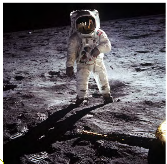
Leider wurde kein Gemüse angepflanzt.

Die noch bestehenden autoritären Strukturen in Deutschland, der Vietnamkrieg und die Notstandsgesetze führten zu Studentenprotesten und Demonstrationen im ganzen Land. Die Bewegung war zunächst friedlich und demokratisch orientiert. Im Laufe der Zeit radikalisierte sich ein Teil der Bewegung und es bildete sich die Rote Armee Fraktion.