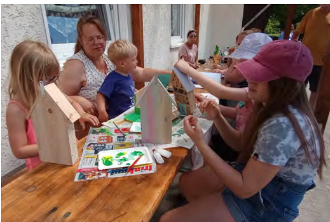
Der Nachwuchs im Einsatz.

Am 3. und 6. Juni fand eine ganz besondere, kostenlose Aktion statt: Unsere jüngsten Gartenfreunde waren eingeladen, ihrer Kreativität beim Basteln von Insektenhotels und Eichhörnchen-Futterhäuschen freien Lauf zu lassen.