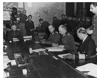
Unterzeichnung der Kapitulation in Reims.

Am 16.04.1945 marschierten die Alliierten über das Oberbergische kommend in die Stadt Wuppertal ein. Auf Gegenwehr trafen die