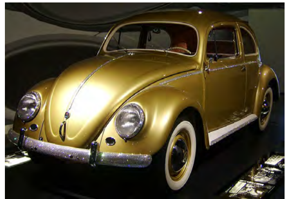
Symbol des Aufschwungs. Der VW Käfer. Hier der Millionste VW Volkswagen.

Die Jahre 1950-1960 in Deutschland könnte man als „Wirtschaftswunder und gesellschaftlicher Wandel“ bezeichnen. Es war die Zeit des Wiederaufbaus nach dem Zweiten Weltkrieg, geprägt von wirtschaftlichem Aufschwung, politischer Stabilisierung und kultureller Erneuerung. Auch in Wuppertal normalisierte sich das Leben. Drei Millionen Kubikmeter Trümmer, etwa die Hälfte des in Wuppertal lagernden Schutts, waren zu dieser Zeit beseitigt. Das Kleingartenwesen in Deutschland erlebte eine Blütezeit. Sie diente nicht mehr nur der Selbstversorgung, sondern wurden zu Orten der Erholung und Freizeitgestaltung. Die Kleingärtnervereine verzeichneten einen Mitgliederzuwachs.