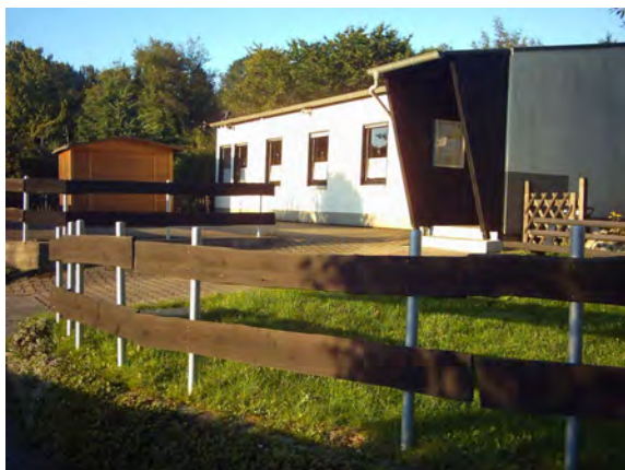
Das Vereinsheim noch ohne Vordach.

2010 wurde die nun mehr als 31 Jahre gültige Vereinsatzung durch eine neue ersetzt. Sie berücksichtigt die geänderte Rechtsprechung sowie zeitlich angepasste Formulierungen.