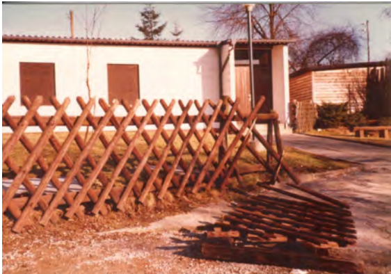
Das Vereinsheim im Jahr 1995

1990 wurde das Vereinsheim renoviert. Es wurden 300 Arbeitsstunden geleistet. Leider beteiligten sich nur 11 der 86 Gartenbesitzer, so dass ein Großteil der Arbeit am Vorstand hängen blieb. Ziel der Renovierung war es, den Innenraum so gemütlich zu gestalten, dass nicht nur die Männer des MTV gerne zum „Klönen“ kommen, sondern auch die eigenen Mitglieder.