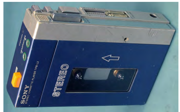
Der erste Walkman.

1977 eskalierte der Linksterrorismus in Deutschland. Die RAF entführte den Arbeitgeberpräsidenten Hanns Martin Schleyer und forderte die Freilassung inhaftierter RAF-Mitglieder. Parallel dazu entführte eine mit der RAF verbündete palästinensische Gruppe ein Lufthansa-Flugzeug. Die Geiselnahmen endeten tragisch: Die entführten Passagiere wurden in einer spektakulären Aktion in Mogadischu befreit, aber Schleyer wurde von der RAF ermordet. Der Deutsche Herbst führte zu einer intensiven gesellschaftlichen Debatte über Terrorismus und Sicherheit.