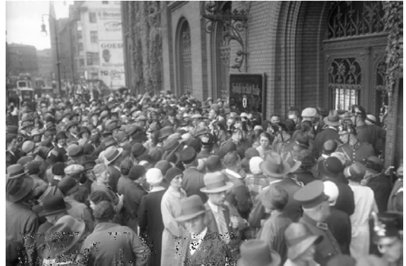
Massenandrang bei der Berliner Sparkasse nach Schließung der Banken im Juli 1931.