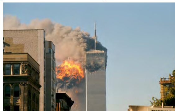
Ein Bild, das sich in das kollektive Gedächtnis eingegraben hat.

Mit den verheerenden Terroranschlägen am 11.09.2001 endete für viele Menschen auf der Welt das Gefühl der relativen Sicherheit. Das Misstrauen gegenüber fremd wirkenden Menschen steigt. Sicherheitskontrollen werden verstärkt. Der Krieg im Irak und in Afghanistan wird uns noch Jahre, gar Jahrzehnte noch beschäftigen.