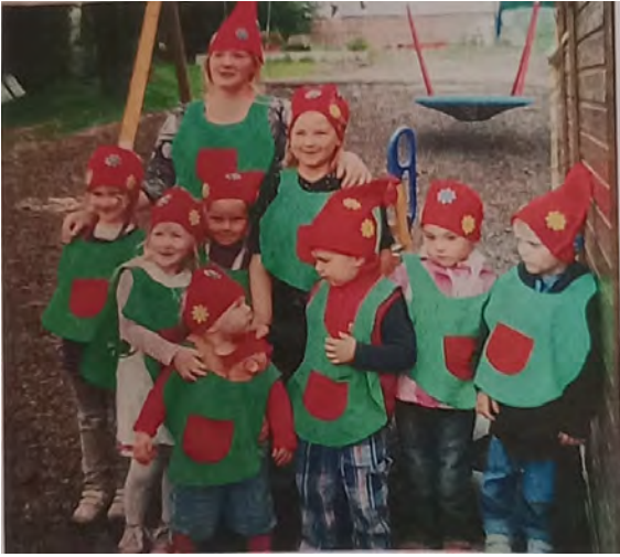
Die Gartenzwerge weihen den neuen Spielplatz ein.

In mühevoller Gemeinschaftsarbeit wurde 2011 der Spielplatz in Eigenleistung errichtet und von den „Gartenzwergen“ feierlich eingeweiht.