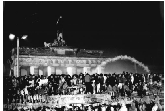
Jahreswende 1990 / 1991. Die Menschen feiern gemeinsam auf der Berliner Mauer.

Der 3. Oktober 1990 markiert nicht nur die Wiedervereinigung Deutschlands, sondern auch das Ende des Kalten Krieges.