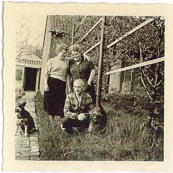
Undatiertes Foto. Gemüseanbau trat in den Hintergrund. Zeit mit Familie und Freunden verbringen stand hoch im Kurs.

Der Druck auf den Wohnungsmarkt ließ allmählich nach und das Wohnen in den Lauben war nicht mehr notwendig. Das Augenmerk der Kommunen richtete sich zunehmend auf die ordnungsgemäße Nutzung der Kleingärten. Vor allem die Bauwut mancher Gartenfreunde war den Oberen ein Dorn im Auge. So wurden beispielsweise Vorschriften erlassen, wie Lauben zu streichen seien. Auch musste so manche zu groß geratene Laube wieder zurückgebaut werden.