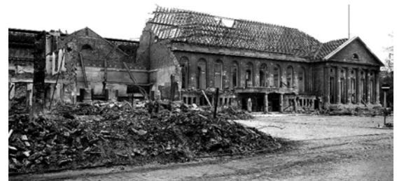
Barmer Bahnhof nach dem Luftangriff

Der Zweite Weltkrieg erlebte in den Jahren 1940 bis 1943 entscheidende Wendepunkte und dunkle Kapitel. Während die Alliierten militärische Erfolge feierten und sich das Kriegsglück zu wenden begann, mündete die systematische Verfolgung der Juden in der „Endlösung der Judenfrage“. Vernichtungslager wurden errichtet und Millionen Juden ermordet. Dies ist eines der dunkelsten Kapitel des Krieges und der Menschheitsgeschichte.