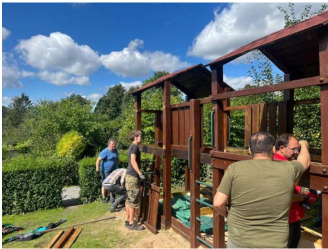
Fleißige Helfer während der Gemeinschaftsarbeit

Im Jahr 2011 wurde der Spielplatz vor dem Vereinsheim von den „Gartenzwergen“ feierlich eingeweiht und 2018 zum ersten Mal saniert (nachzulesen in der Chronik auf Heckengefuester.de oder in der 3. Ausgabe).