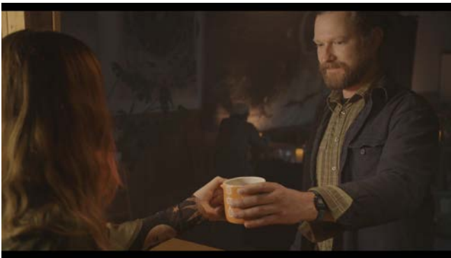
Szene aus dem Film