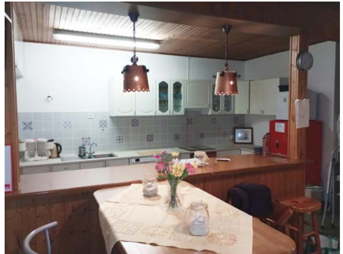
Die neue Küche. Hell, offen, kommunikativ

2023 war es wieder soweit: Einige Reparaturarbeiten mussten durchgeführt werden. Dank der tatkräftigen Hilfe der Vereinsmitglieder ist der Spielplatz nun wieder (TÜV-)sicher.