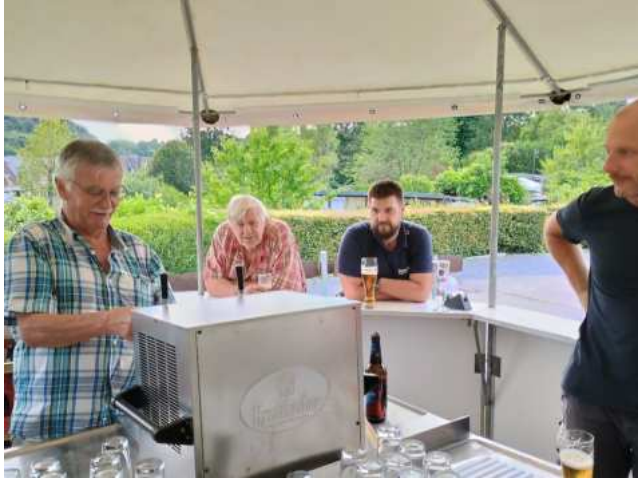
Gute Stimmung herrschte schon beim Fassanstich am Freitag. Hier stimmte auch das Wetter noch.

Was für ein Fest! Trotz des wirklich nassen Sonntags war unser Sommerfest am 5. und 6. Juli ein voller Erfolg. Der Samstag lockte viele Besucherinnen und Besucher in unsere Anlage, und selbst am regnerischen Sonntag war die Stimmung erstaunlich gut.