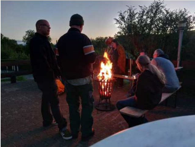
Gemütliches Miteinander am Lagerfeuer.

Am 5. Oktober wurde das traditionelle Herbstfest gefeiert, und auch wenn weniger Mitglieder als erwartet kamen, tat das der Stimmung keinen Abbruch. Kulinarisch war einiges geboten: Von herzhaftem Leberkäs und knusprigen Brezn bis hin zum klassischen Obatzda – und einer kreativen Variante mit Feta – war für jeden Geschmack etwas dabei. Und natürlich durfte das passende Oktoberfestbier nicht fehlen.