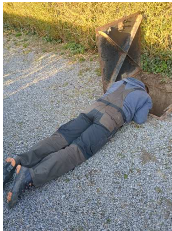
Mehrere Tage sind wir auf dem Boden herumgekrochen, um ein größeres Leck im System zu finden.

Andere Dinge sind kostspieliger: Seit Jahren haben wir Schwierigkeiten, einen Bierwagen für das Sommerfest zu bekommen. Manche Vermieter fahren ihre Wagen nicht mehr über den steilen Weg, der Piaggio, den wir zuletzt genutzt haben, ist bereits ausgebucht. Daher haben wir uns einen eigenen Bierpavillon inklusive Waschtisch, Kühlschrank und Zapfanlage gekauft. Auch die alte Ölheizung im Vereinsheim muss perspektivisch ersetzt werden – idealerweise, bevor sie zum Instandsetzungsfall wird. Weitere Ideen betreffen einen neuen Boden im Vereinsheim, neues Mobiliar oder einheitliches Geschirr und Gläser für Veranstaltungen. Wir gehen dabei sehr bewusst und sparsam vor, suchen gezielt nach gebrauchten Geräten