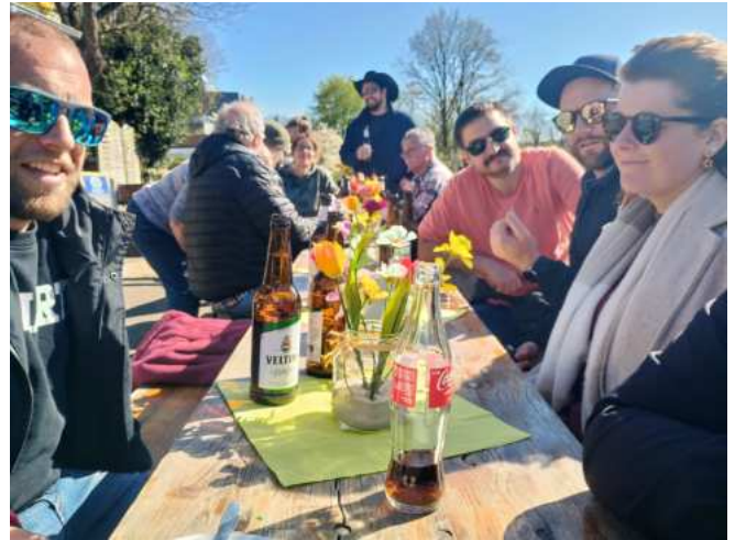
Sonnenschein, lecker Kaffee, Waffeln und Bier. Was will man mehr?

Zwar war das Fest dieses Jahr nicht so gut besucht, doch die anwesenden Mitglieder genossen die entspannte Atmosphäre. Es zeigte sich einmal mehr, dass es oft nicht auf die Zahl der Teilnehmer ankommt, sondern auf die schönen gemeinsamen Momente, die man miteinander teilt. Wir freuen uns schon jetzt auf das nächste Jahr und hoffen, dass wieder viele von euch dabei sein werden!