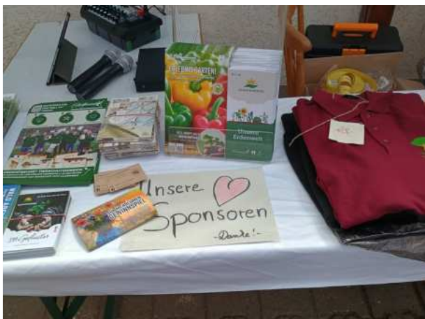
Danke an unsere Sponsoren

Auch das Schnurrad durfte nicht fehlen – diesmal in etwas kleinerer Ausführung, aber wie gewohnt ein echter Spaß für Jung und Alt.